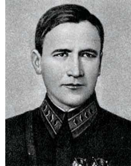
Командарм 2-го ранга Седякин А.И. Начальник управления ПВО РККА (МПВО)