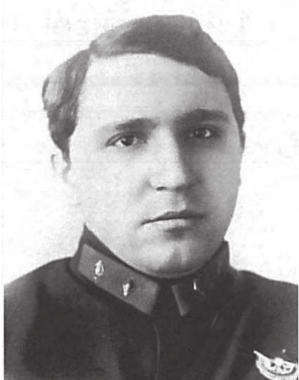
Комдив Медведев М.Е. Первый начальник МПВО с 1932 г. по 1934 г.