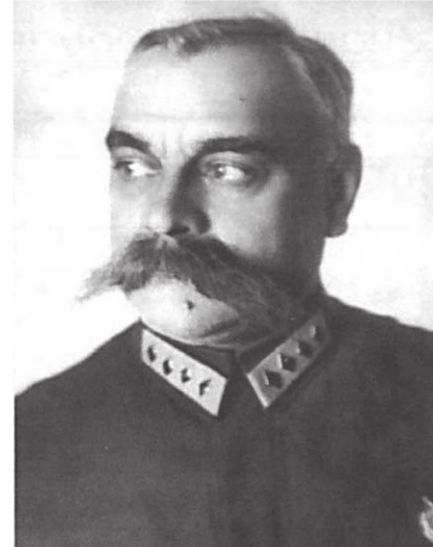
Командарм первого ранга Каменев С.С. Начальник управления ПВО РККА (МПВО) с 1934 г. по 1936 г.