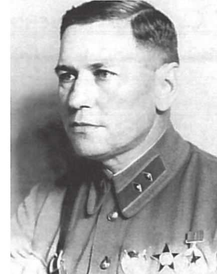
Генерал-лейтенант Осокин В.В. Начальник ГУ МПВО НКВД СССР с 1940 г. по 1950 г.

1937 – 1938 гг. – исполняющий обязанности начальника управления ПВО РККА комдив Блажевич И.Ф.